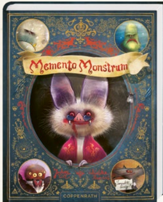
Memento Monstrum (Bd. 1) Vorsicht, bissig! ISBN 978-3-649-63010-4