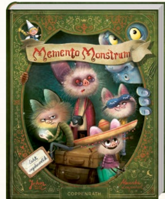
Memento Monstrum (Bd. 3) Echt ungeheuerlich ISBN 978-3-649-67206-7