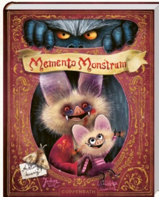
Memento Monstrum (Bd. 2) Achtung, haarig! ISBN 978-3-649-63894-0